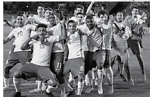
Goleiros da Seleção Brasileira Sub-17 que conquistaram o título do sul-americano disputado no Chile.