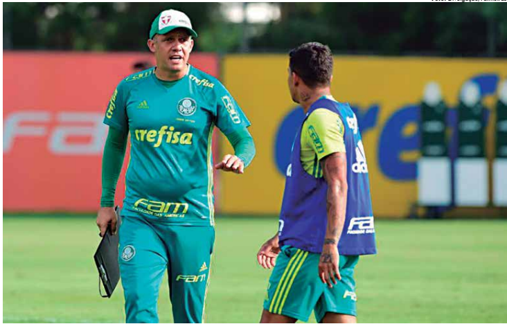
O técnico Eduardo Baptista disse que a sequência de jogos nas competições é fundamental para solidificar o trabalho no comando técnico do Palmeiras