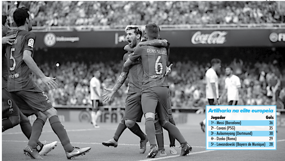
Messi é abraçado pelos companheiros do Barcelona após a marcação de gol contra o Valencia pelo Campeonato Espanhol. O meia argentino segue quebrando recordes no futebol europeu.

Em relação a esta estatística, um dado que comprova o feroz assassino do jogador quando o assunto são gols: de acordo com a empresa Opta, ele é o único atleta que, atuando na Primeira Divisão do Campeonato Espanhol, fez mais de 40 gols (contando todas as